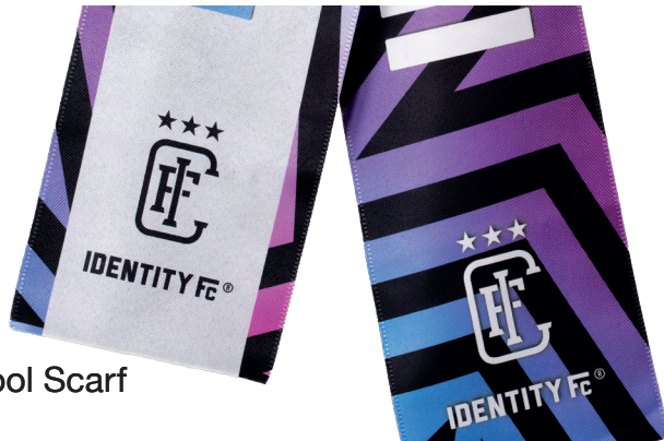
The Cool Scarf

Bufanda de animadora con sublimación de alta definición. Tejido ligero, fácil de llevar, suave y cómodo. Personalización a todo color con impresión por sublimación vibrante. Una forma divertida de promocionar una marca y mostrar apoyo.